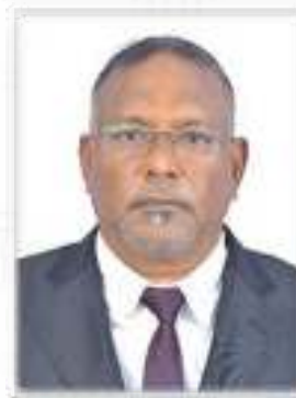
پروفیسر شعیب احمد