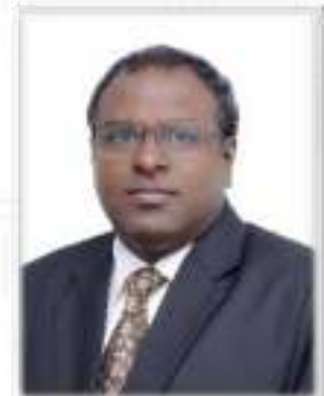
پروفیسر شعیب احمد