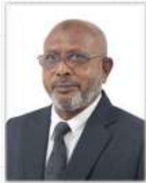
پروفیسر مسعود احمد خان