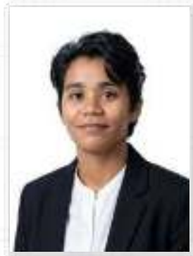
پروفیسر سحر علی