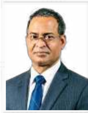
پروفیسر حفیظ الرحمن