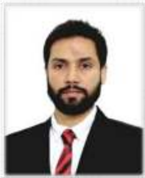
پروفیسر شعیب احمد